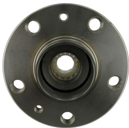
Ložisko s nasadeným plastovým krúžkom

SKF svoje produkty v obale chráni pred poškodením pri preprave alebo montáži. Sada VKBA 3497 je dodávaná s plastovým krúžkom, ktorý drží vnútorné časti ložiska dokopy až kým sa namontuje.